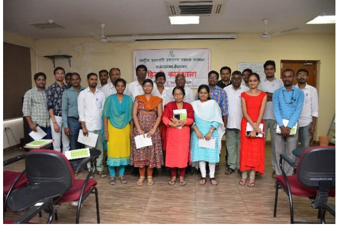
(एनआईपीएचएम में 'हिंदी कार्यशाला' का आयोजन)