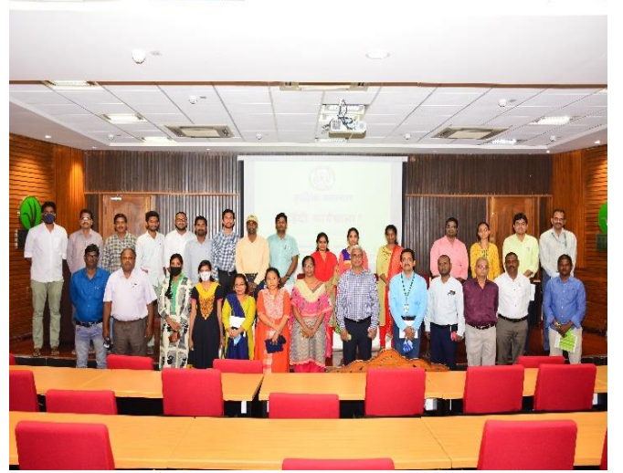
(एनआईपीएचएम में 'हिंदी कार्यशाला' का आयोजन)