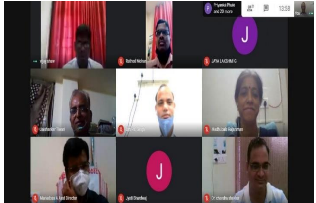
(ऑनलाइन के माध्यम से 'हिंदी दिवस' समारोह का आयोजन)