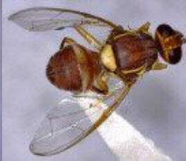
Peach Fruit fly Bactrocera zonata