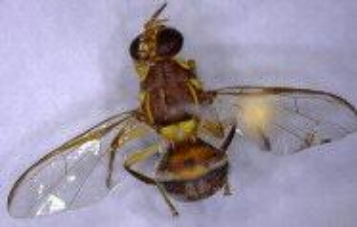
Mango Fruit fly Bactrocera dorsalis