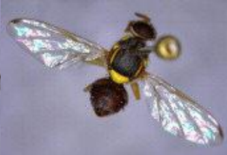
Guava Fruit fly Bactrocera correcta