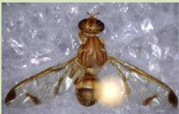
Melon Fruit fly Bactrocera cucurbitae